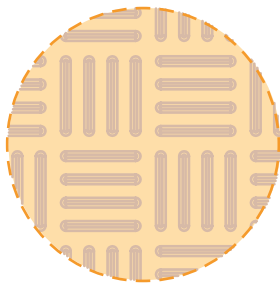
■ Detalle relieve